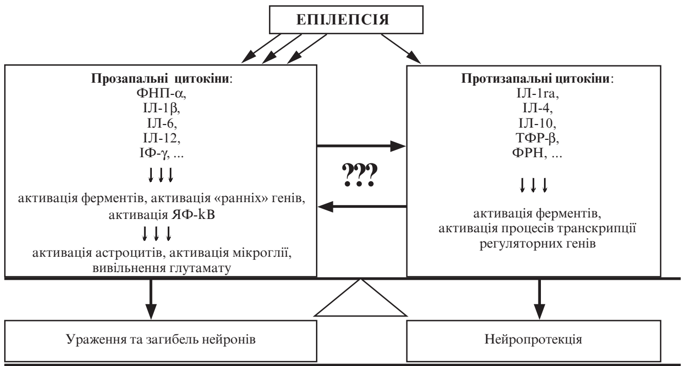
Рис. 1. Функціональна взаємодія про- і противапальних цитокинів за умов епілепсії. Подані основні представники сімейств цитокинів та їх ефекти, частина з яких аналогічна ефектам при процесі запалення

ЦНС і складається зі щільно прилеглих один до одного нефенестрованих ендотеліоцитів. Робота ГЕБ залежить від нормального функціонування периваскулярно розташованих клітин мікроглії, астроцитів і базальної мембрани, які межують із капілярами й іншими судинами мікроциркуляторного русла, за якими кров надходить до головного мозку. За нормальних умов ГЕБ спричинює захисну дію в ЦНС, обмежуючи надходження до неї субстанцій із плазми крові й імунних клітин. Проникність ГЕБ збільшується при різних захворюваннях ЦНС і патологічних процесах — судомному синдромі [15], інфекційних, травматичних й ішемічних процесах у ЦНС. При епілепсії та інших неврологічних захворюваннях, які супроводжуються появою судом, рекомендується вживати заходів щодо збільшення проникності ГЕБ, а також зміни його клітинного складу [16].