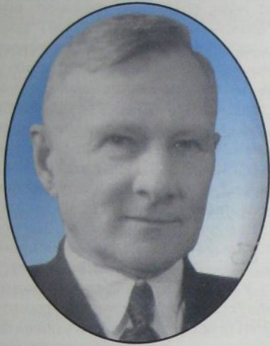
ПІНЕВИЧ МИХАЙЛО ВАСИЛЬОВИЧ (1888 – 1974)