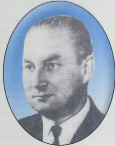
РИБІННИК ІЗРАЇЛЬ МОЙСЕЙОВИЧ (1921 – 2004)